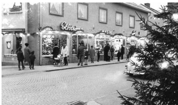
Elfströms skoaffär 1968