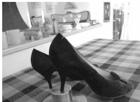
Ebbas italienska pumps i lila mocka

Innan vi skiljs åt är vi rörande överens om det välbehag och den livskvalitet som välgjorda detaljer och välsydda sömmar i kläder och skor ger oss.