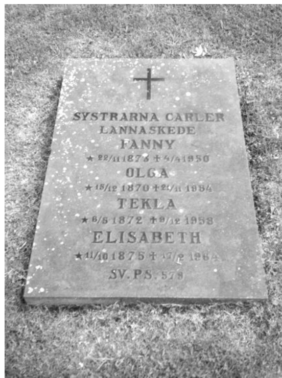
Systrarna Carlers gravsten i Lannaskede